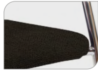
Zitting in Regain, zwart Seat in Regain, black