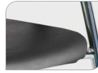
Zitting in kunstleer Seat in imitation leather