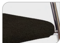
In Stoff Regain, schwarz En tissu Regain, noir