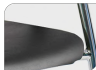
Gepolstert in Kunstleder Dossier et assise en similicuir