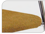
Zitting in Regain, kleur Seat in Regain, color