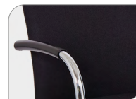
Armlehnen mit Leder Griff Accoudoirs en cuir