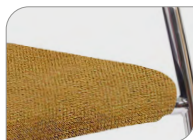
In Stoff Regain, farbe En tissu Regain, coloré